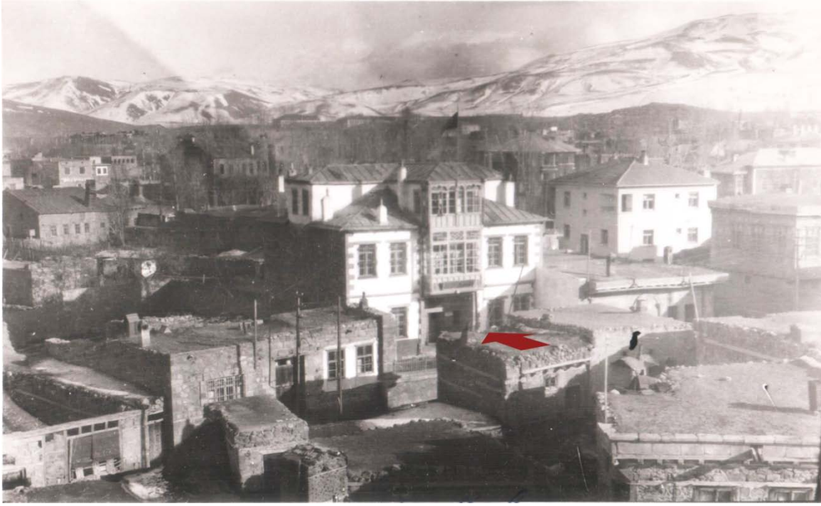
Resim 3. Gölbaşı semti, Orta Ticaret Okulu