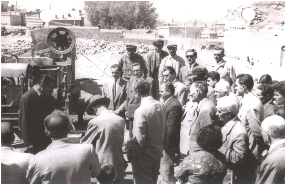
Resim 4. Okulumuzun mevcut yerleşkesine temel atma töreni

1957 yılında Ticaret ve Turizm Öğretim Genel Müdürlüğü tarafından Esatpaşadaki arsa (okulun şimdiki mevcut bulunduğu yer) alınıp 25.08.1958 de temeli atılan müstakil yeni bina inşa ettirilmiştir (Resim4). 10.05.1974 tarihindeki bina tescil kartından anlaşıldığı üzere Erzurum Ticaret Meslek Lisesi adıyla okul binası 1959 yılında yapılmış 1959-1960 okul eğitim öğretime başlamıştır.