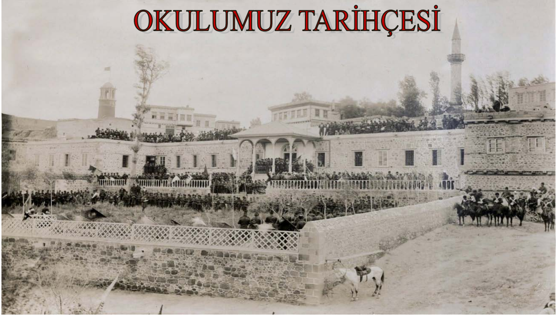
Resim 1. 1903 Yılında Yapıtılan Sanayi Mektebi